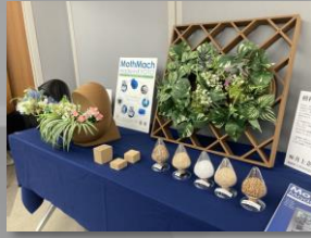
リサイクル材料活用サンプル (SLAB製3Dプリンター)