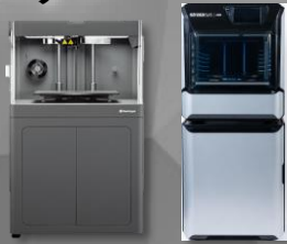
Markforged Industrial X7 Stratasys J55 Prime